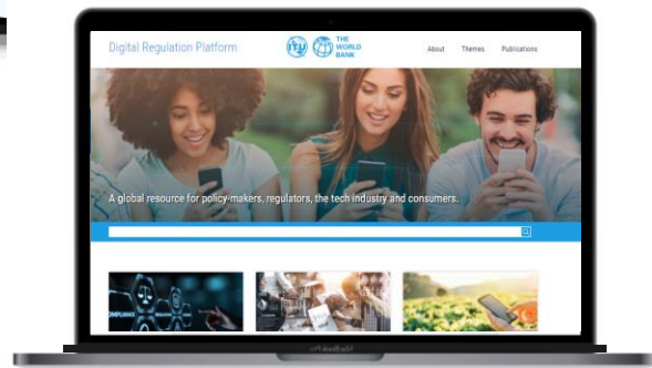
Plate-forme interactive de régulation du numérique