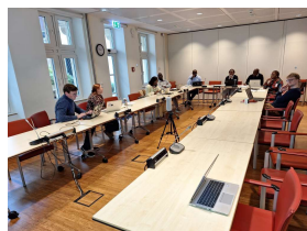
République du Congo