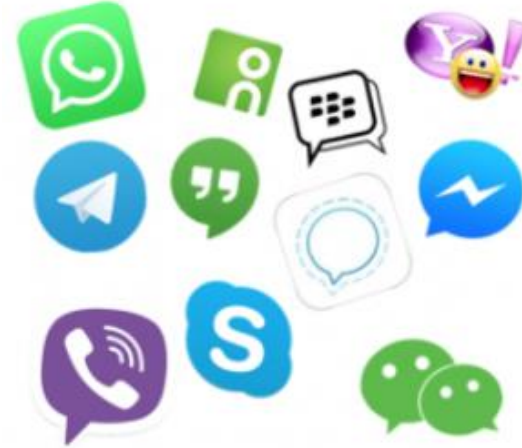
Exemples de services Over the Top

L'innovateur va tenter de contourner les barrières légales et réglementaires en offrant un service nouveau qui n'est pas dans le marché ni en dehors du marché